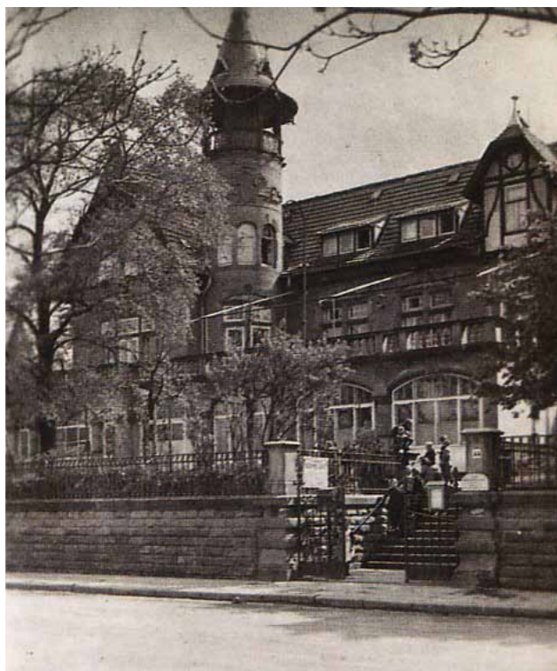
El primer jardín de infancia Waldorf, en Stuttgart