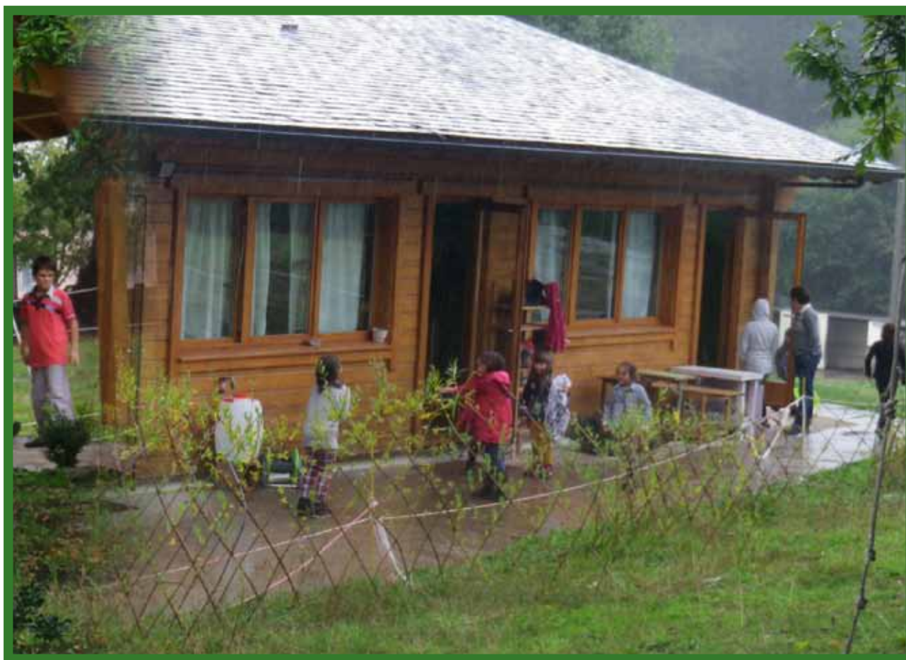
Nueva escola Waldorf «Meniñeiros» de Lugo

Revista de la Asociación de Centros Educativos Waldorf-Steiner de España